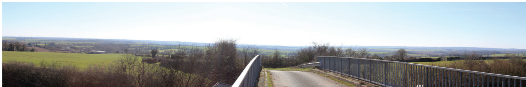
Vue panoramique de l'état initial (angle de vue 120°)