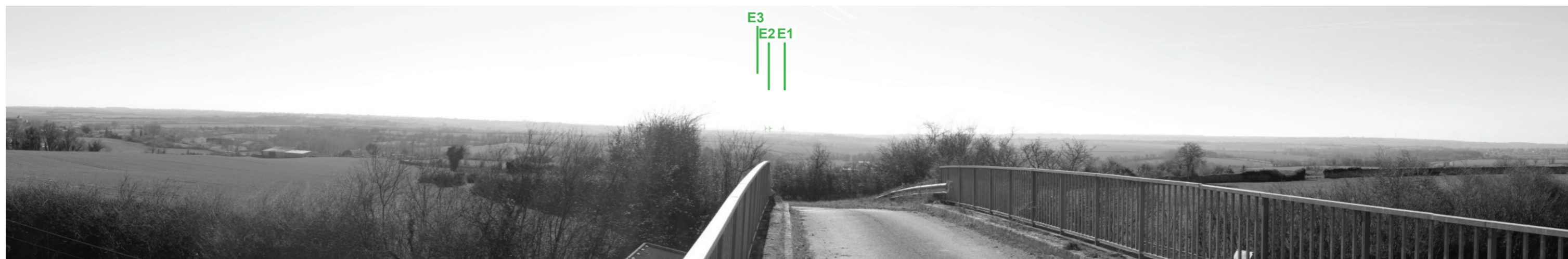
Vue panoramique noir et blanc avec esquisse du projet (angle de vue 120°)

Coordonnées Lambert II étendu : 415044 / 2158427 Date et heure de la prise de vue : 14/02/2019 à 14:34 Focale : 52 mm, équivalent 24 x 36 Azimut vue réaliste : 181° Angle visuel du parc : 1,3° Eolienne la plus proche : E1, à 18 129 m